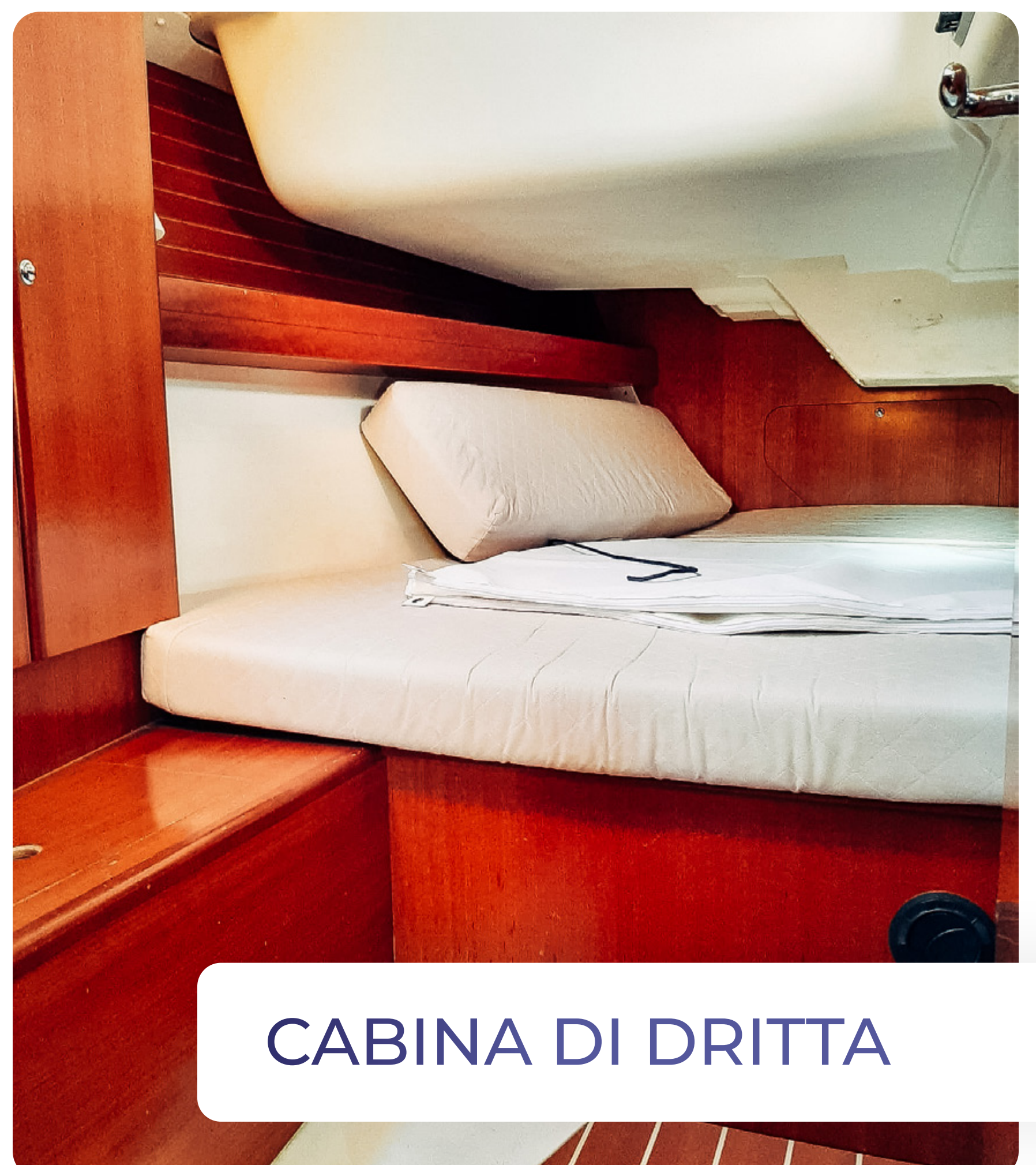
CABINA DI DRIITA