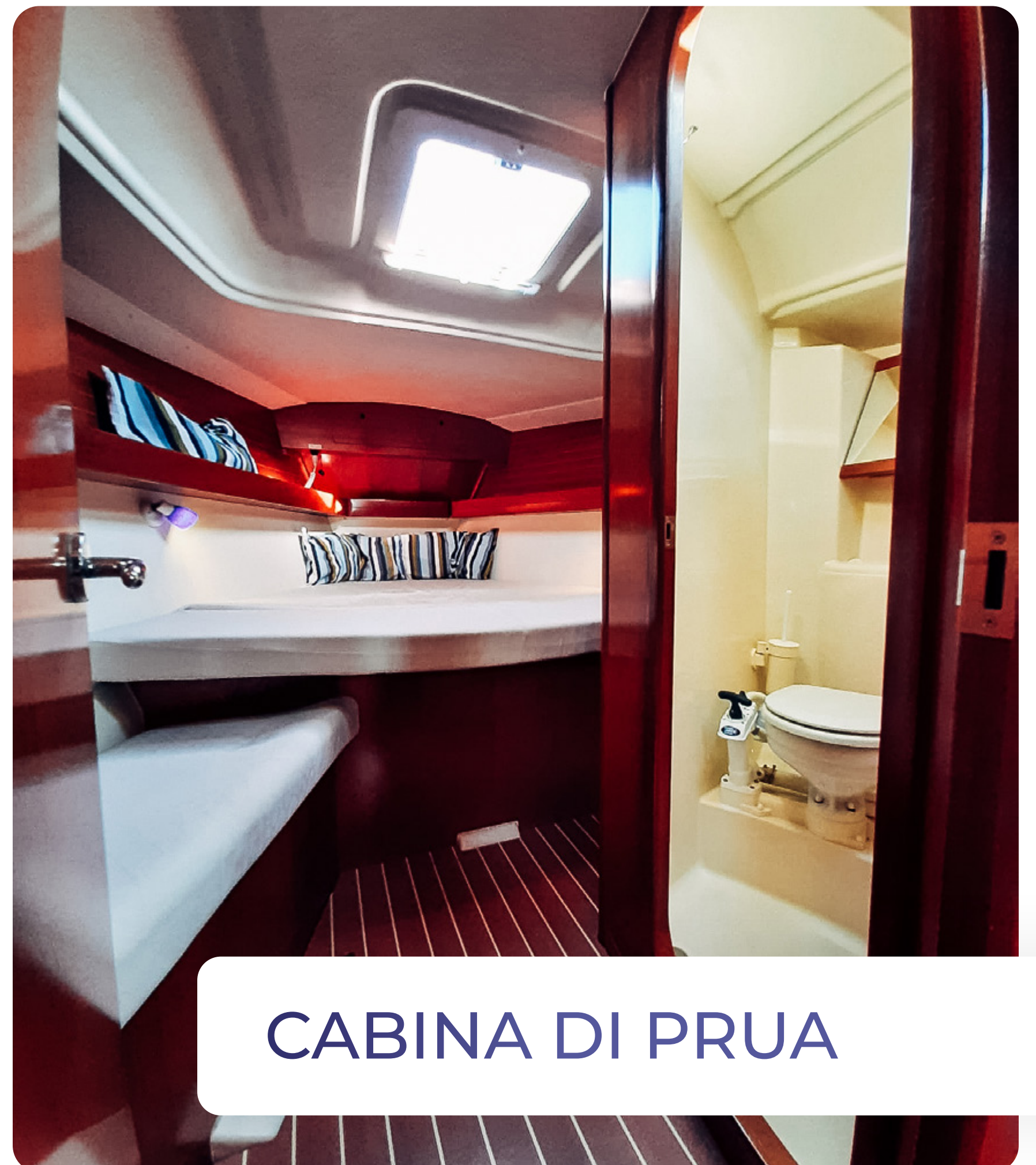
CABINA DI PRUA