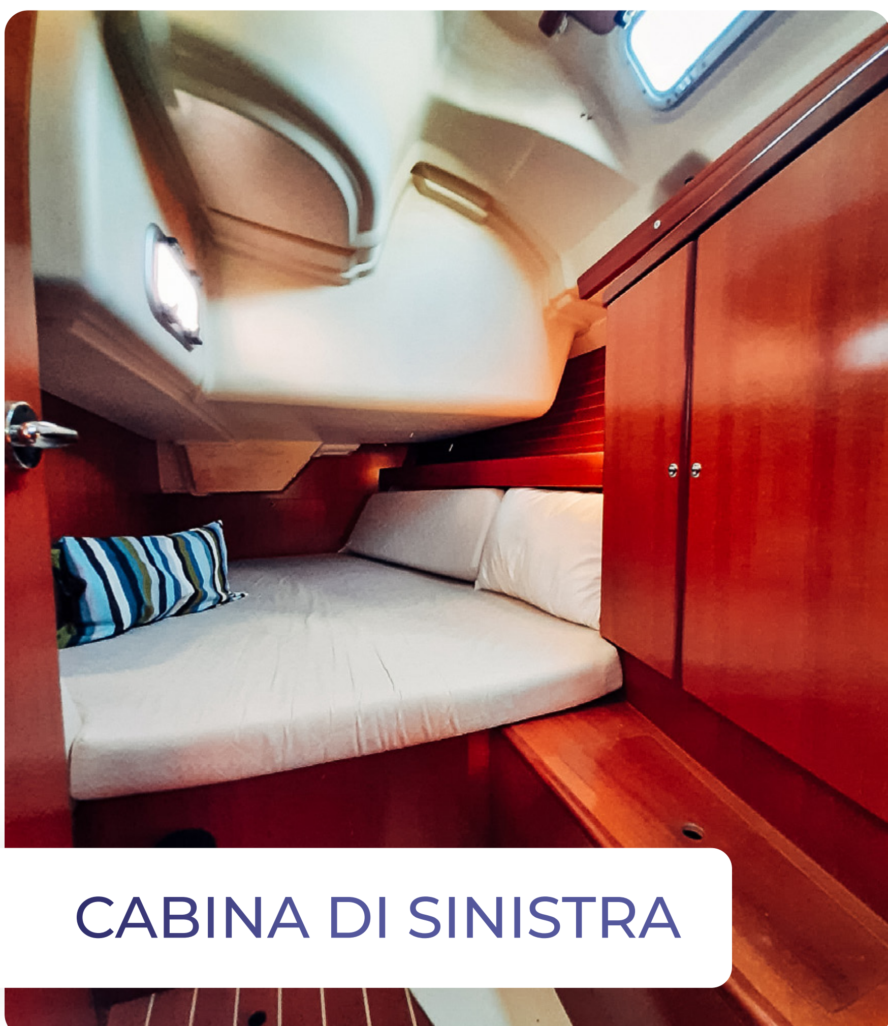
CABINA DI SINISTRA