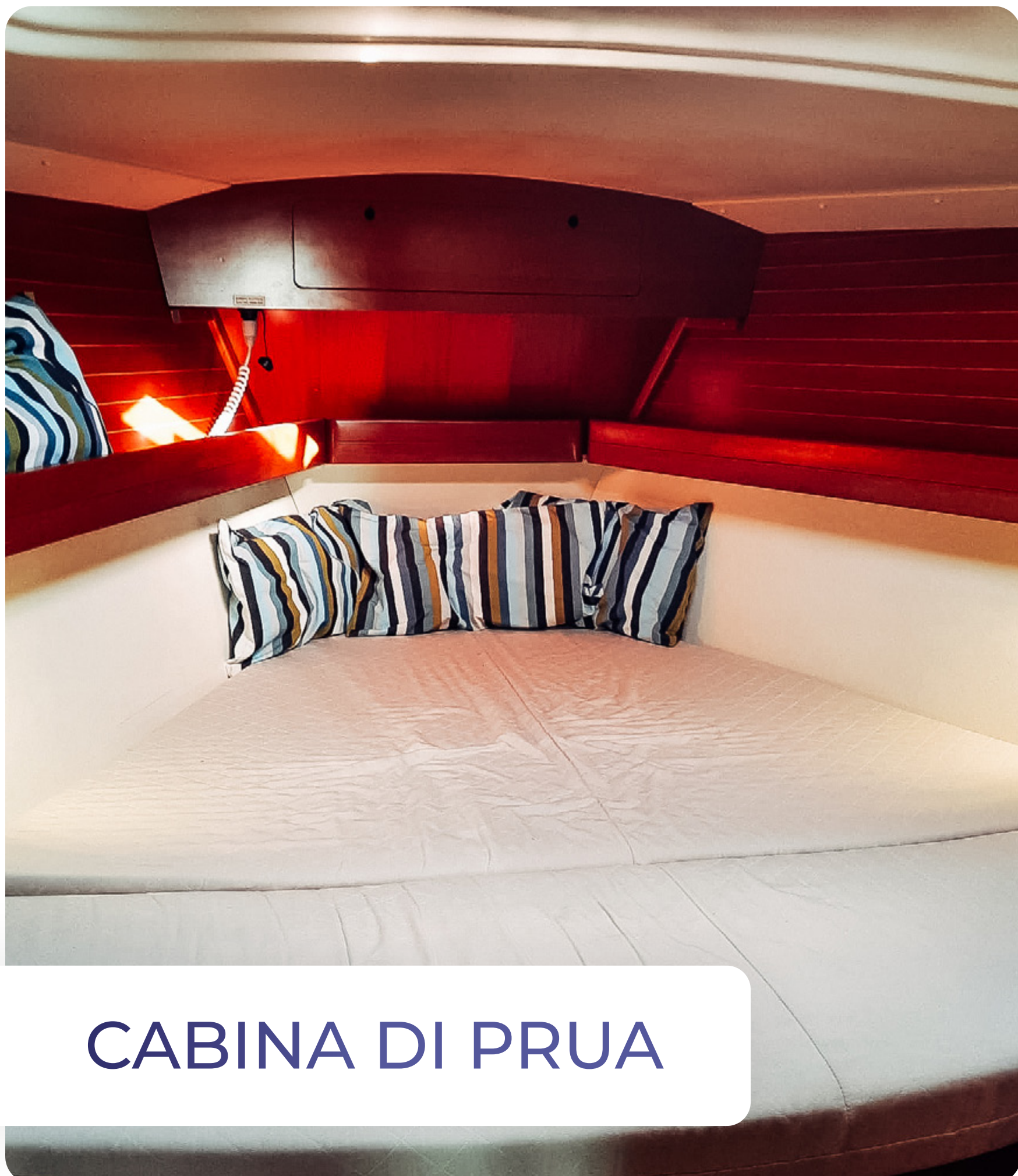
CABINA DI PRUA